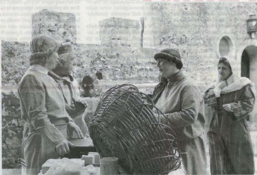
Attori e figuranti dell'Associazione culturale «TraDuMari» che curerà la seconda edizione della «Festa FedEricina».

Da sabato 30 e per 4 giorni (quindi, fino al 2 giugno), infatti, nel Borgo Medievale si svolgerà la seconda edizione della «Festa FedEricina». Attori e figuranti dell'Associazione culturale «TraDuMari», che daranno vita al Corteo Regale di sua Maestà Federico III D' Aragona, re di Sicilia e della moglie Eleonora D'Angiò, stanno definendo gli ultimi preparativi in vista dell'evento che, sulla base dell'eco del successo riscosso dalla prima edizione, non mancherà di richiamare ad Erice turisti provenienti da ogni parte d'Italia.