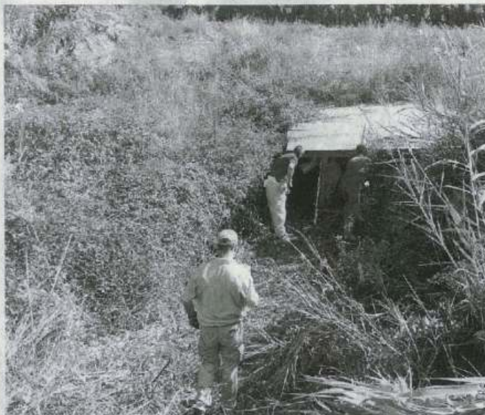
I lavori nell'area archeologica delle Fornaci romane