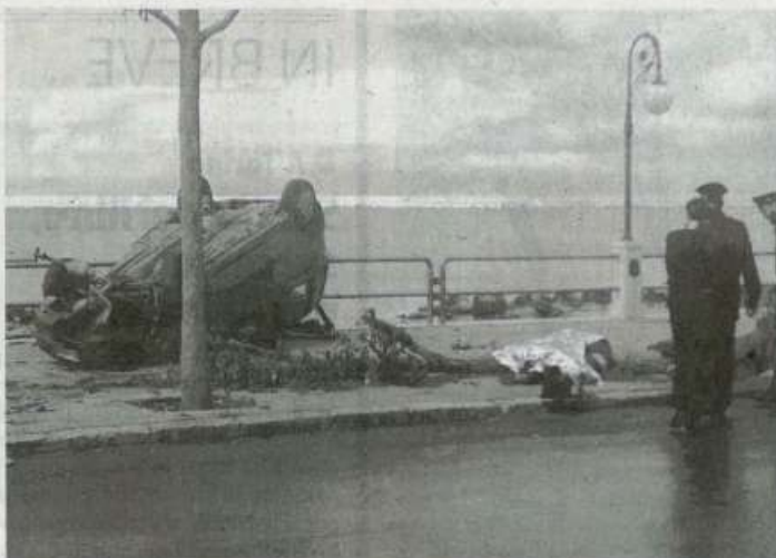
Il luogo del terribile incidente, avvenuto domenica mattina

«Io e la mia famiglia siamo molto dispiaciuti per quello che è successo - dichiara il padre del ragazzo con un filo di voce - non ci sono parole per porgere le nostre scuse e descrivere il nostro dolore. Chie-